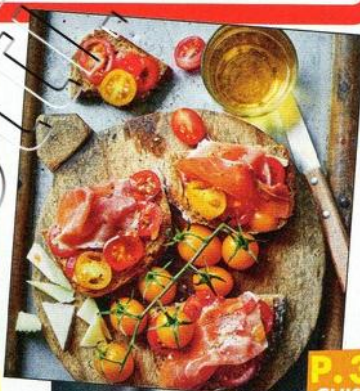
P. 39 CUISINE